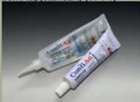
63ml tüp(standart) (17 : 1)