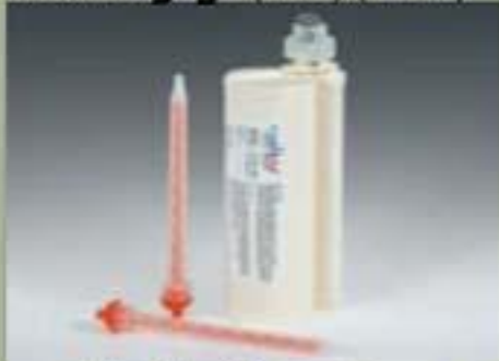
490ml خرطوشة (SBS) (10 : 1)