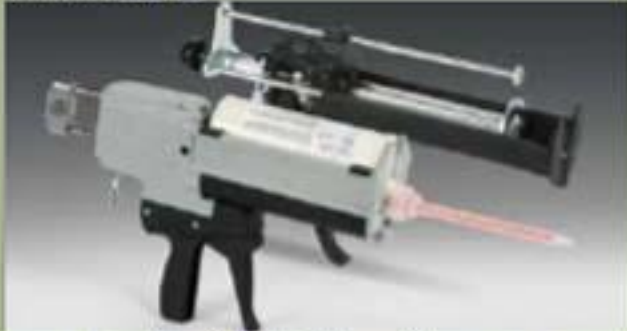
آلة نفثة 490ml