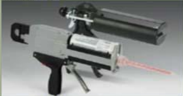
آلة نفثة 250ml