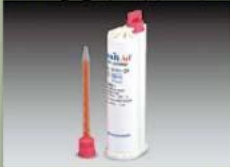
75ml خرطوشة (SBS) (10 : 1)