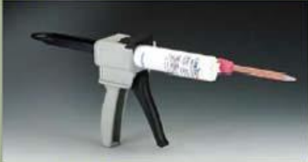
آلة نفثة 75ml