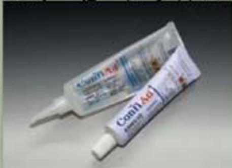
63ml (للإشباع) أسمان (القاعدة) (17 : 1)