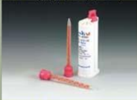
50ml خرطوشة (SBS) (10 : 1)