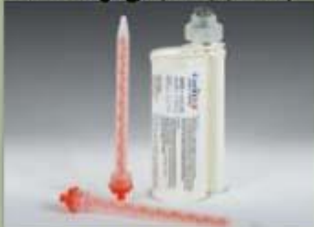
250ml خرطوشة (SBS) (10 : 1)