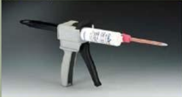
آلة نفثة 50ml