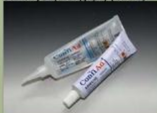
63ml туба(стандарт) (17 : 1)