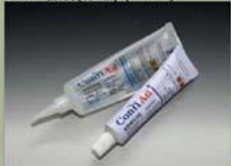
63ml 管装(标准) (17 : 1)