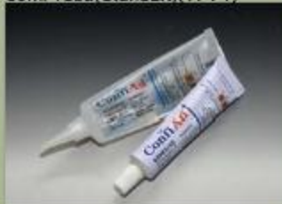
63ml Tuba(Standart)(17 : 1)