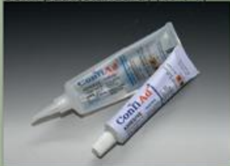
63ml putki(standard) (17 : 1)