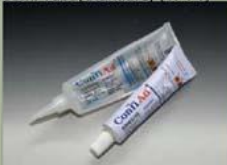
63ml Tube(Standard) (17 : 1)