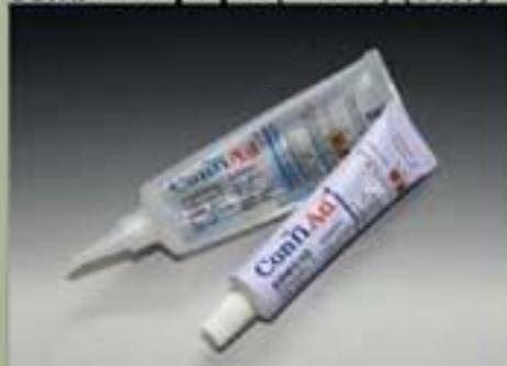
63ml σπληνέριο (Κοινό) (17:1)