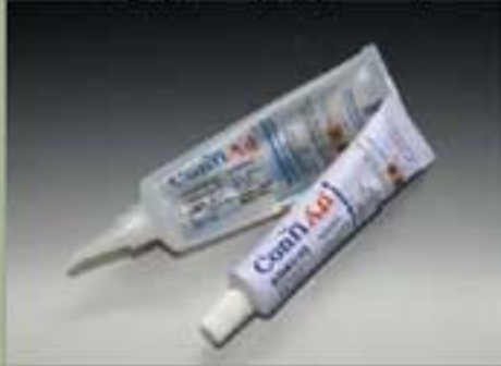
63ml टयख(सटेनदरद)(17 : 1)