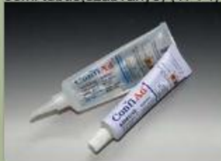
63ml tubus(szabványo) (17 : 1)