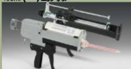
بزار تزریق (سنگ) 490ml