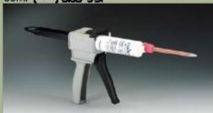
بزار تزریق (سنگ) 50ml