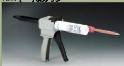
بزار تزریق (سنگ) 75ml