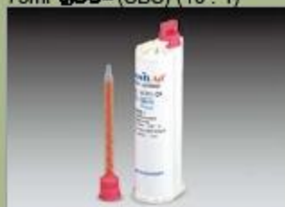
75ml کفازبج (SBS) (10 : 1)