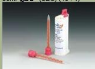
50ml کفازبج (SBS) (10 : 1)