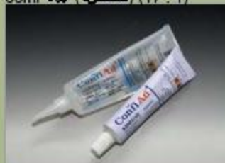
63ml کفوب (سنگ) (17 : 1)