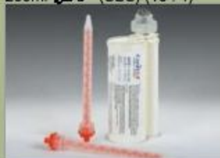
250ml کفازبج (SBS) (10 : 1)