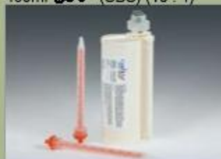
490ml کفازبج (SBS) (10 : 1)