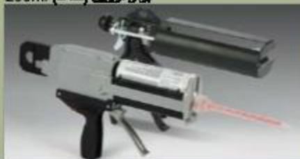
بزار تزریق (سنگ) 250ml