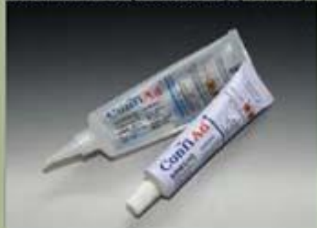
63ml tubetto(standard) (17 : 1)