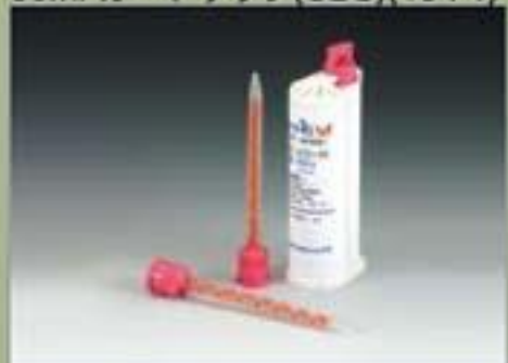
50ml カートリッジ(SBS)(10 : 1)