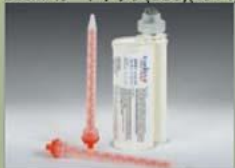
250ml カートリッジ(SBS)(10 : 1)