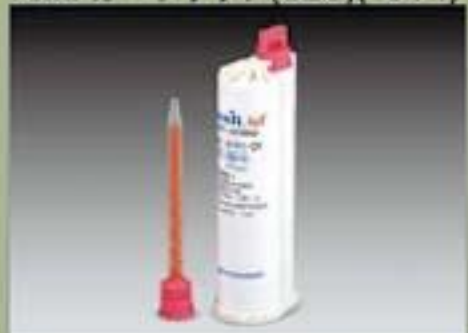
75ml カートリッジ(SBS)(10 : 1)