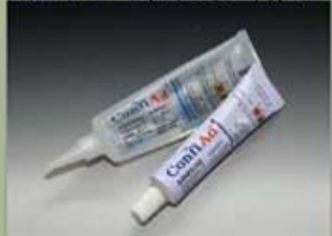
63ml チューブ(スタンダード)(17 : 1)