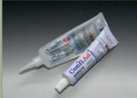
63ml тюбик(стандарт) (17 : 1)