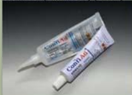
63ml tube(standaard) (17 : 1)