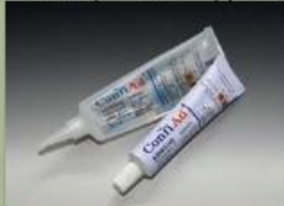
63ml rurki(standardowe) (17 : 1)