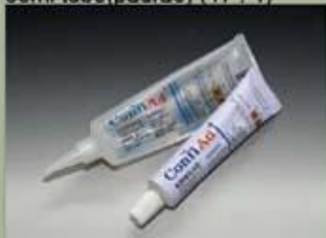
63ml tubo(padrão) (17 : 1)