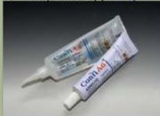
63ml tub(standard) (17 : 1)