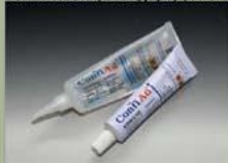
63Мл Тюбик(Стандарт) (17 : 1)