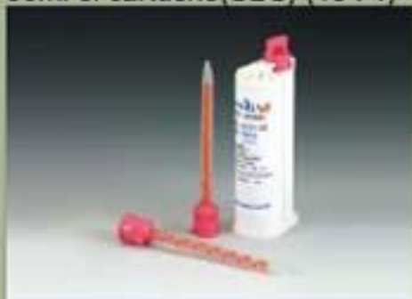
50ml el cartucho(SBS) (10 : 1)