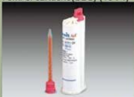
75ml el cartucho(SBS) (10 : 1)