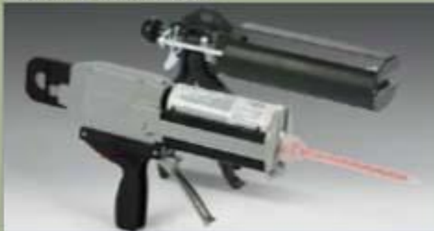
250ml el atomizador