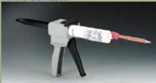
75ml el atomizador