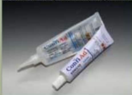
63ml el tubo(el estándar)(17 : 1)