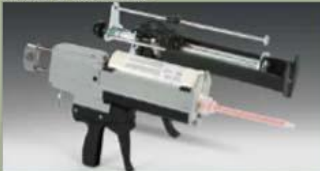
490ml el atomizador