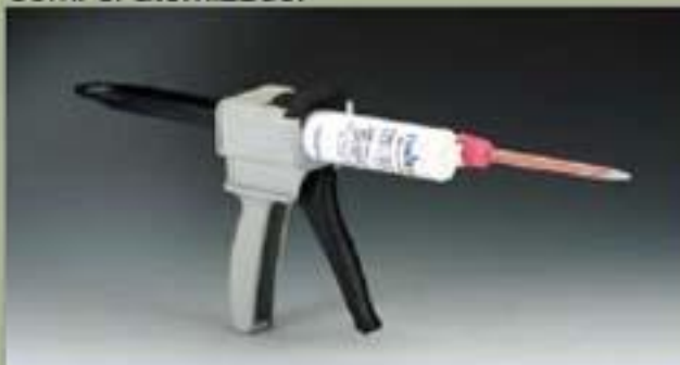
50ml el atomizador