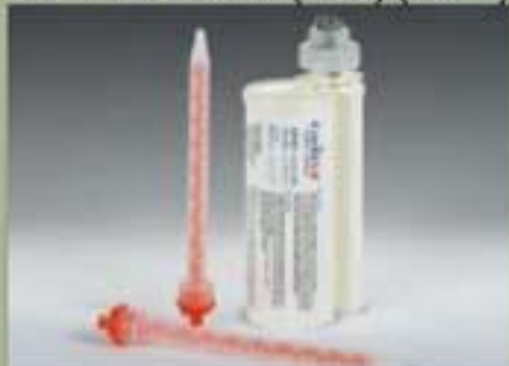
250ml el cartucho(SBS) (10 : 1)