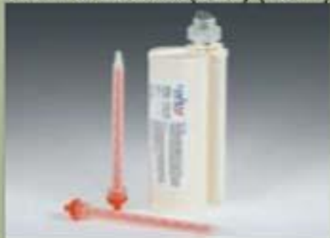
490ml el cartucho(SBS) (10 : 1)