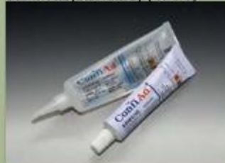
63ml Tub(standard) (17 : 1)