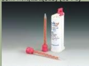
50ml กระสุนปืน(SBS) (10 : 1)