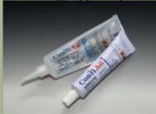
63ml ตะมัน(ราน) (17 : 1)