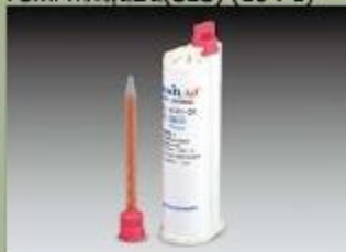
75ml กระสุนปืน(SBS) (10 : 1)