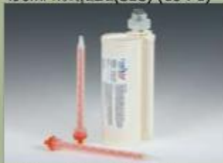
490ml กระสุนปืน(SBS) (10 : 1)