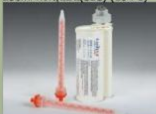
250ml กระสุนปืน(SBS) (10 : 1)