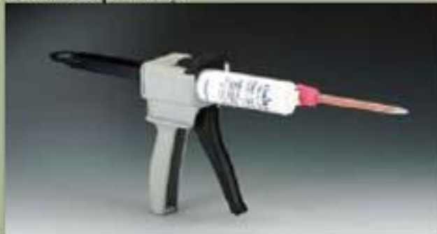
50ml Vòi phun xịt.