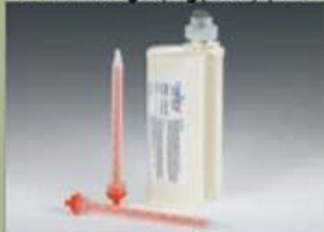
490ml Thùng đựng(SBS) (10 : 1)