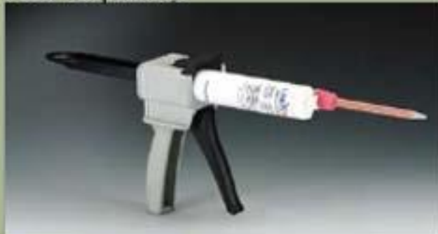
75ml Vòi phun xịt.