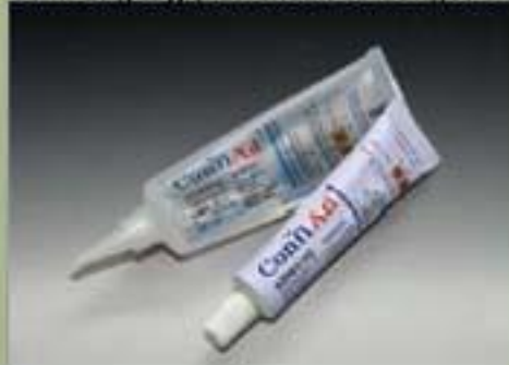
63ml Ống tuýp(tiêu chuẩn cơ bản)(17 : 1)