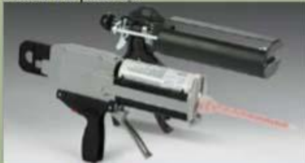
250ml Vòi phun xịt.