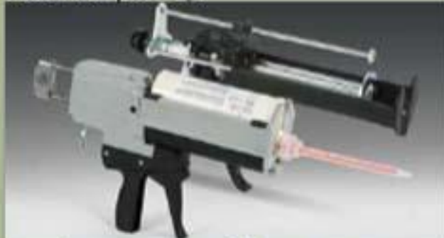
490ml Vòi phun xịt.