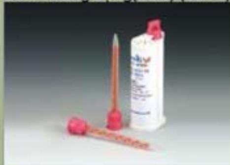
50ml Thùng đựng(SBS) (10 : 1)