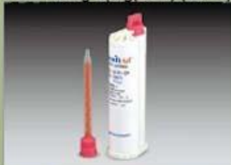
75ml Thùng đựng(SBS) (10 : 1)