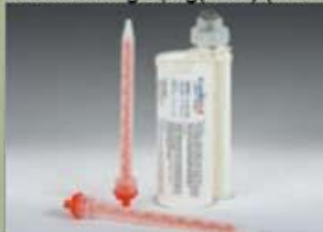
250ml Thùng đựng(SBS) (10 : 1)